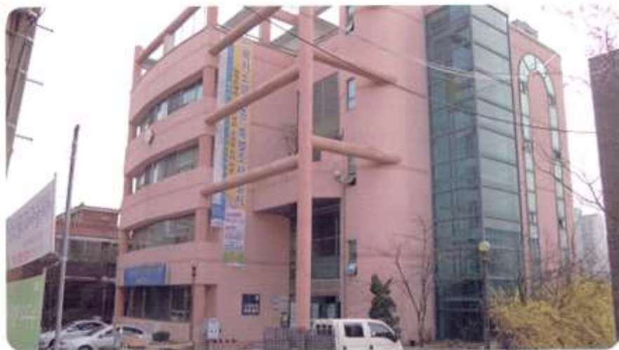
신월6동 주민센터 [ 신월동 568-45 신남3길6 ]