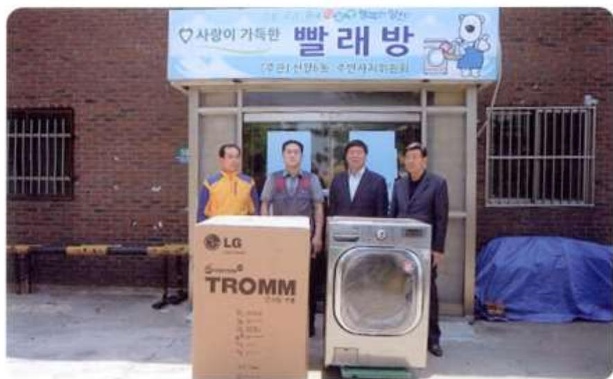
신월6동 사랑이 가득한 빨래방