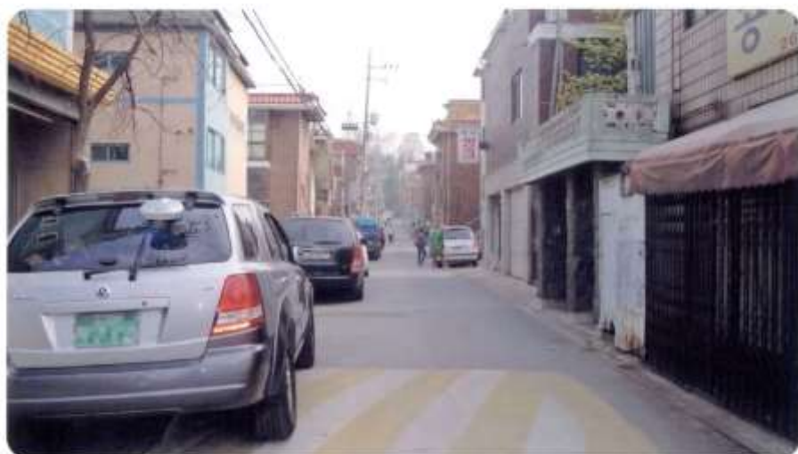
45 신월동 568-1 ~ 568-31 (달맞이길)