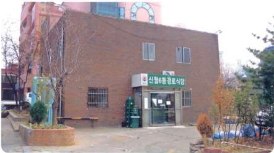
경로식당 [ 신월동 568-19 신남3길58 ]