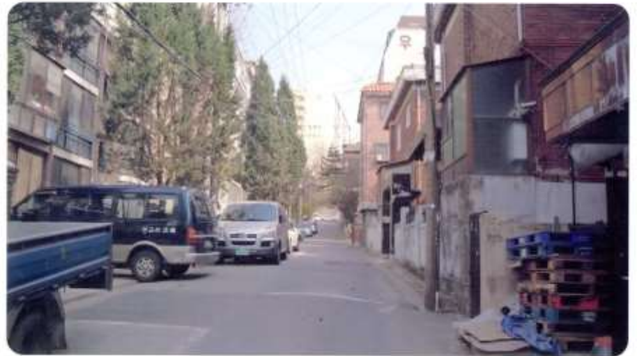
18 신월동 593-1 ~ 593-23 (절골10길)