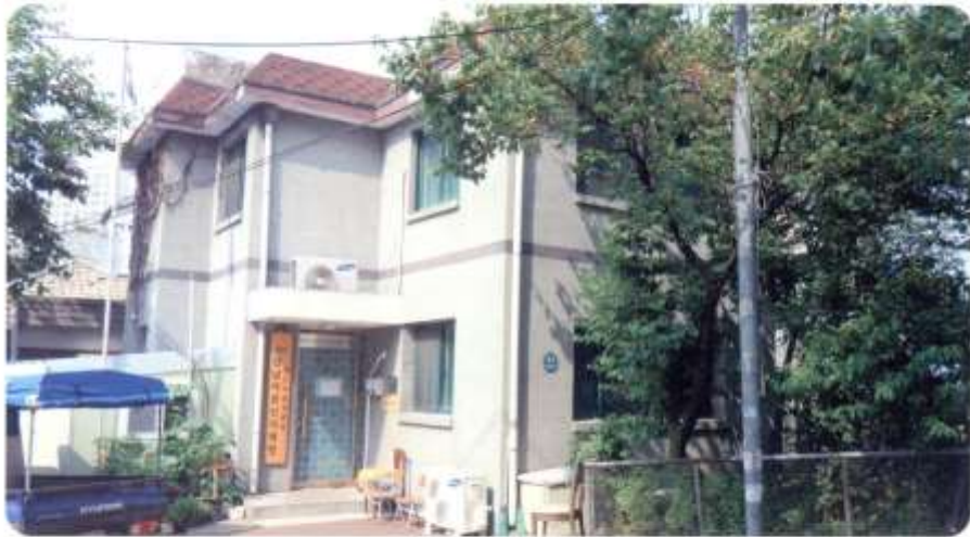
신남어르신사랑방 [ 신월동 586-6 달맞이1길18-6 ]