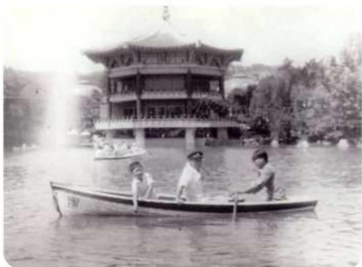
1980년 목동APT 물난리 장면