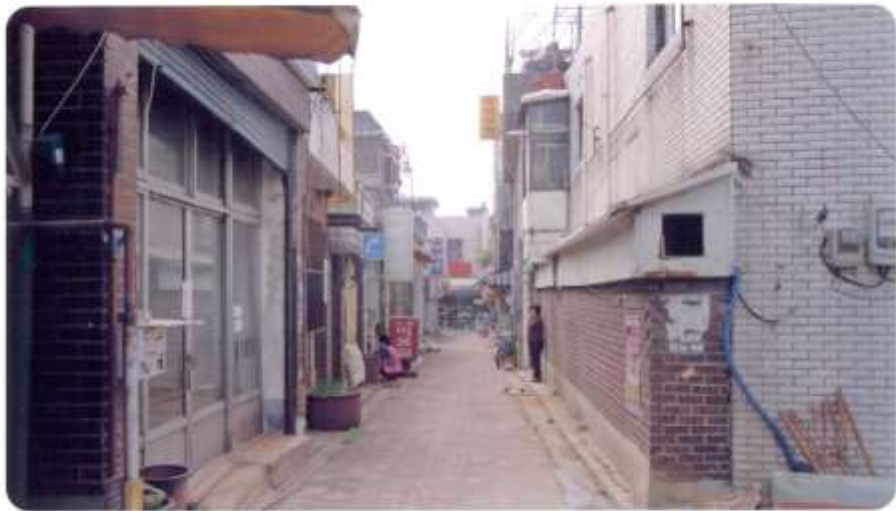
23 신월동 573-1 ~ 573-4 (달맞이1길)