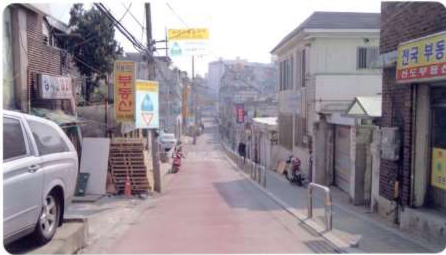
15 신월동 582-2 ~ 583-7 (절골8길)