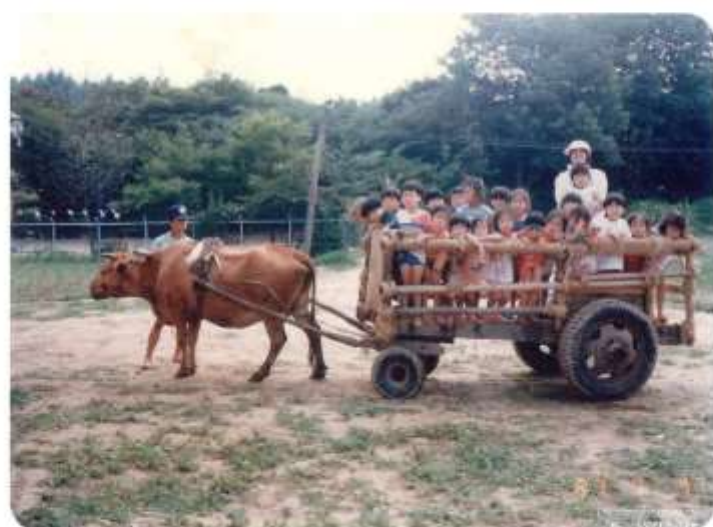
1980년 달구지 통학 (늘푸른마을↔강서초등학교)