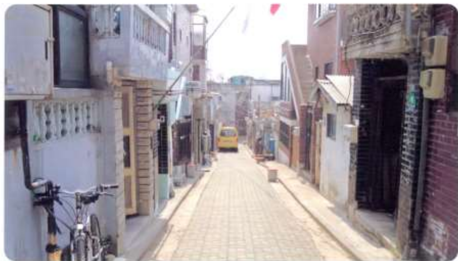
5 신월동 596-1 ~ 596-5 (결골6길)