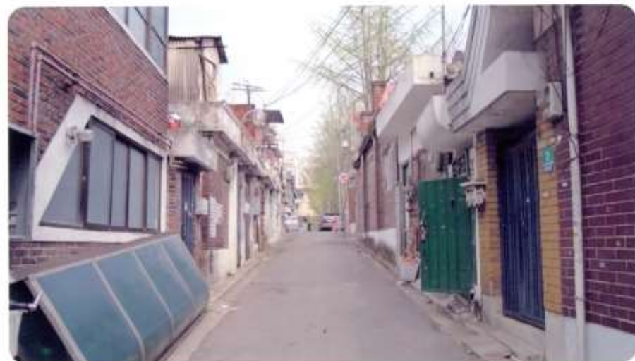
26 신월동 570-13 ~ 570-24 (달맞이4길)