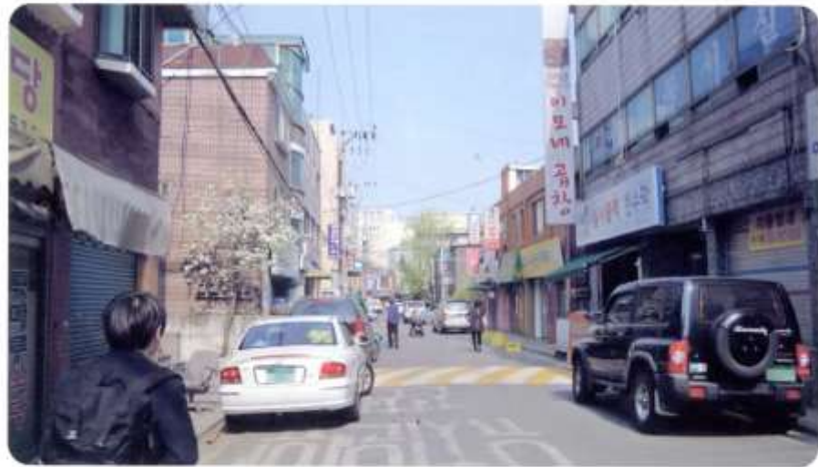
54 신월동 551-1 ~ 557-1 (남부순환로79길)