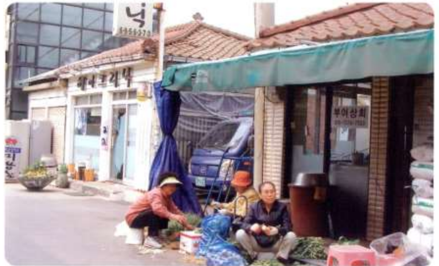
골목길에서 만난 이웃 분들