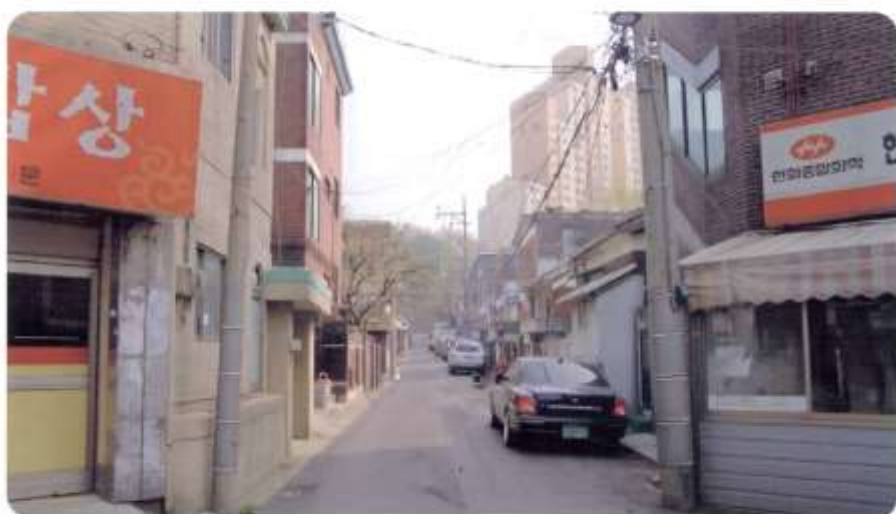
46 신월동 566-1 ~ 566-20 (신남2길)