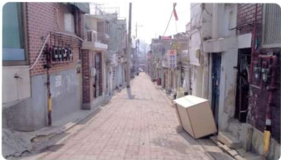
② 신월동 597-1 ~ 597-8 (신월로20길)