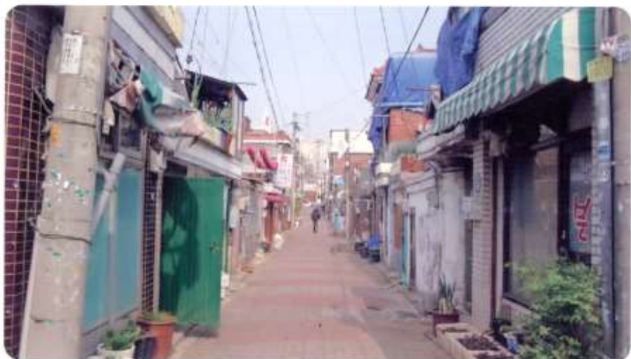
50 신월동 555-1 ~ 555-12 (청황5길)