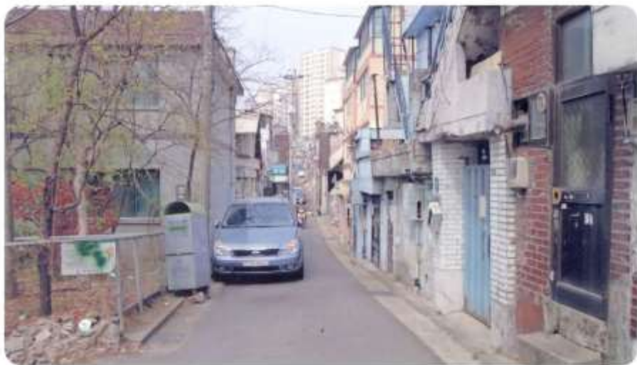
28 신월동 586-6 ~ 586-8 (달맞이길)