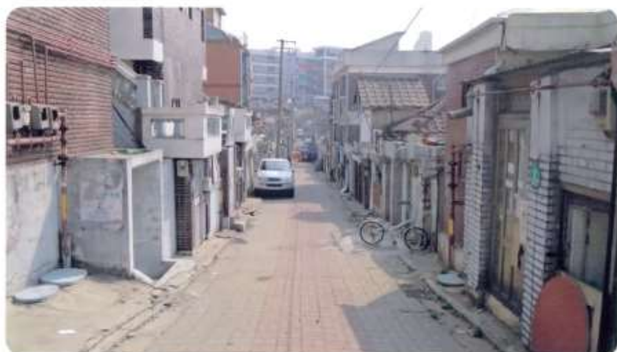
14 신월동 581-2 ~ 581-11 (새곡7길)