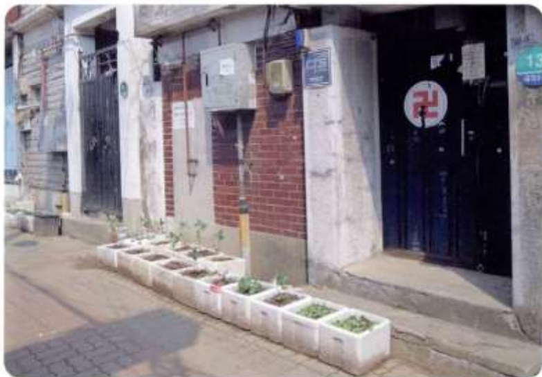
집 앞 상추, 고추 등을 재배하는 모습