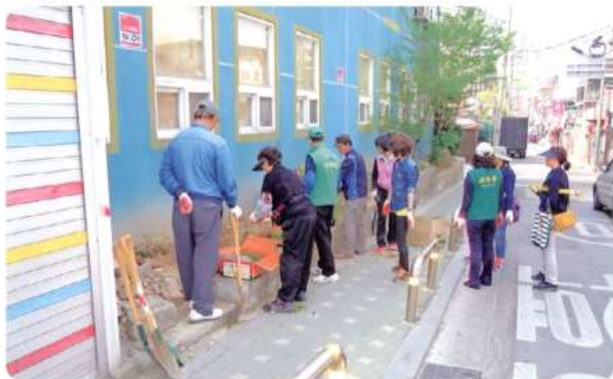
신월6동 우리 지역을 더욱 푸르게 (녹화사업)