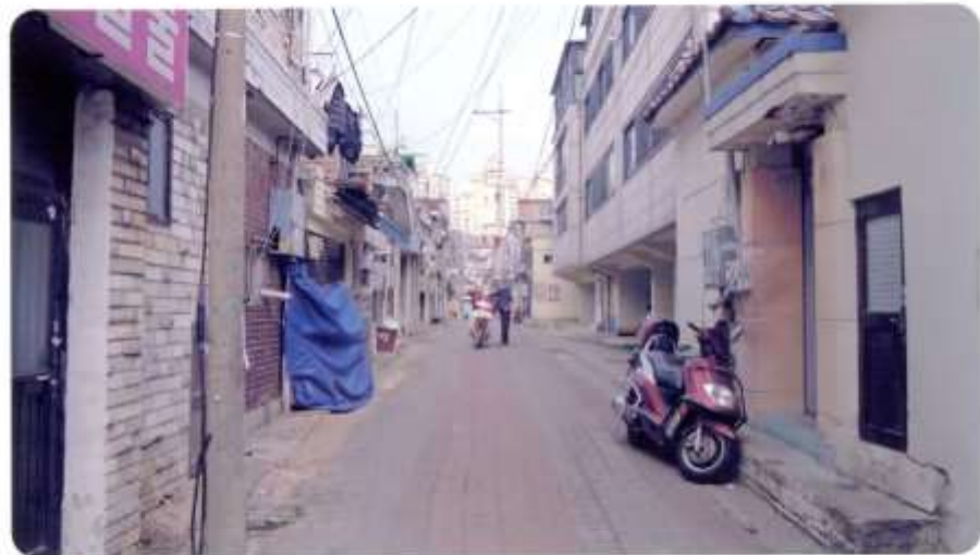
25 신월동 570-1 ~ 570-12 (달맞이3길)