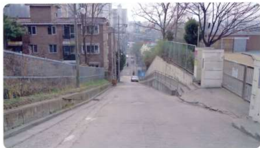
41 신월동 567-1 ~ 567-14 (학동3길)