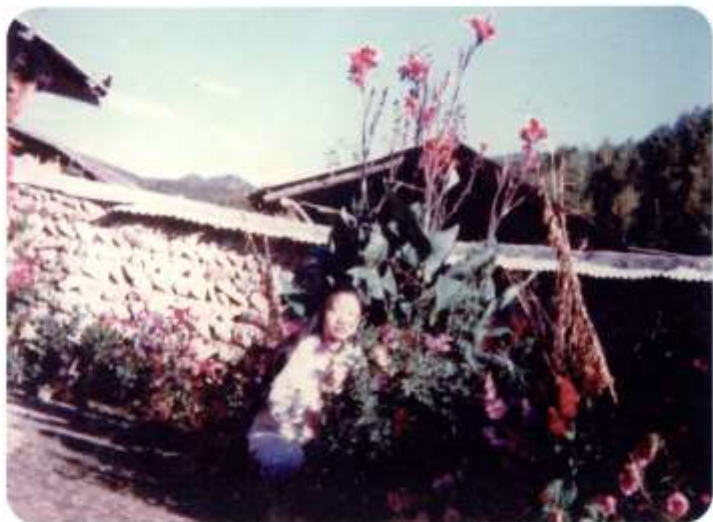
1978년 돌을 쌓아 만든 돌담장