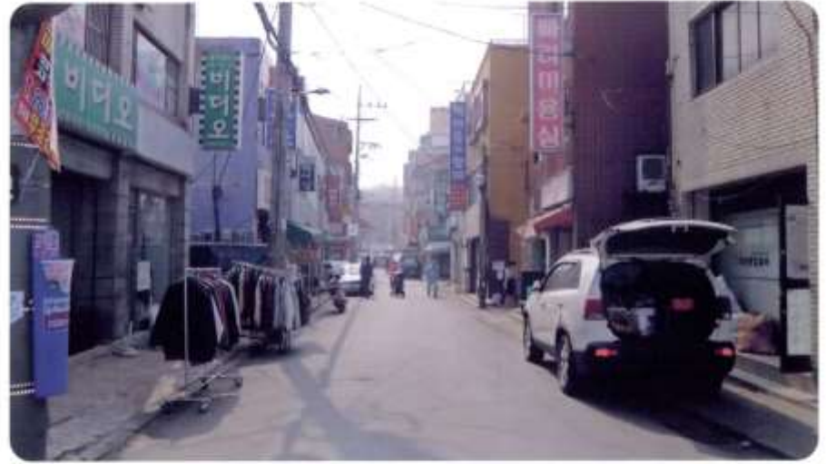
57 신월동 556-37 ~ 597-6 (신남길)