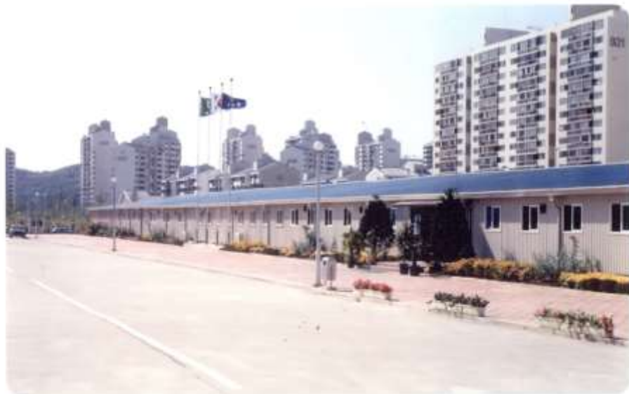
1988. 양천구청 옛 청사