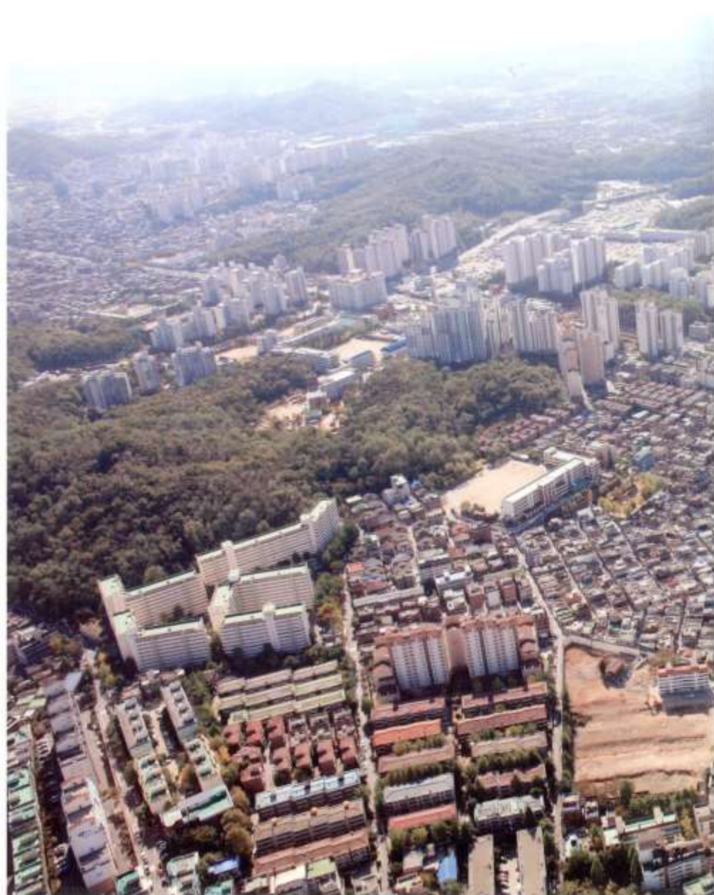
항공사진-1 (앞쪽 좌측에 있는 아파트가 신안약수아파트)