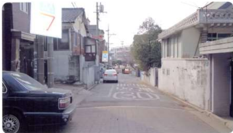
36 신월동 592-6 ~ 592-13 (절골12길)