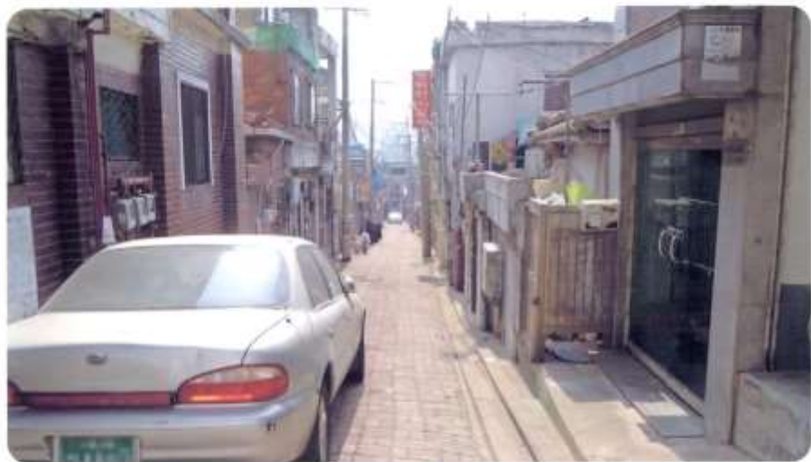
3 신월동 598-1 ~ 598-10(새곡1길)