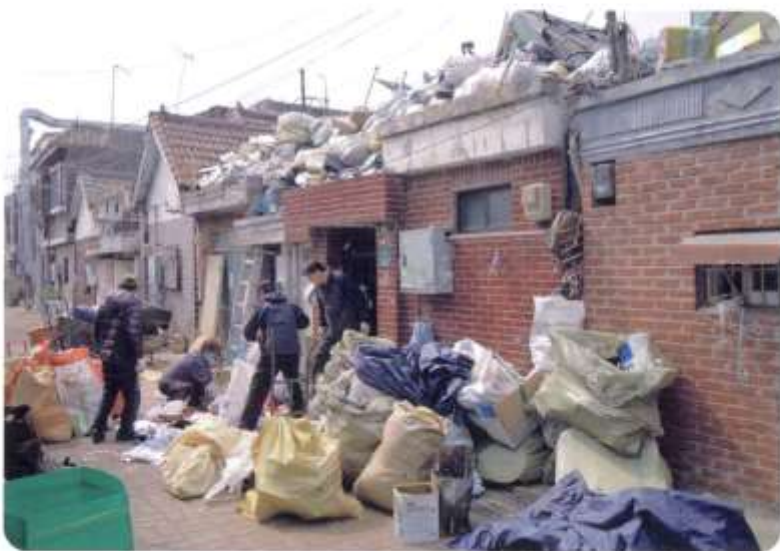
재활용품이 넘쳐나는 집안과 지붕