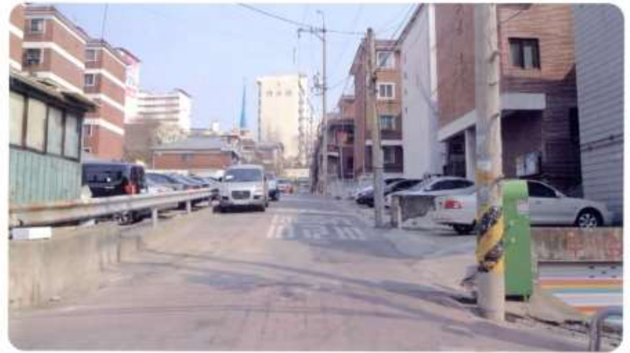
17 신월동 594-1 ~ 594-11 (절골9길)