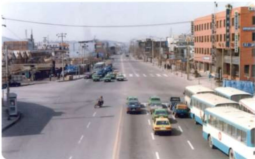
1984. 도로 양측으로 최초 국민택시인 포니2의 정겨운 모습