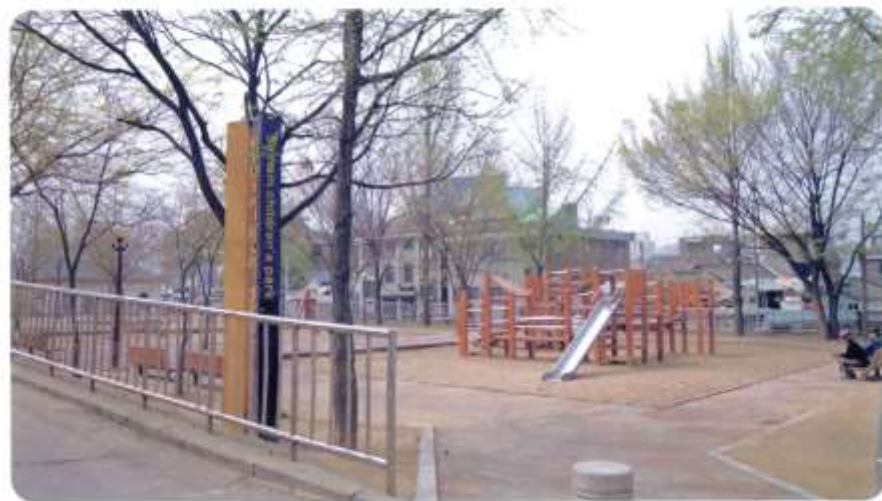
신남어린이공원 [ 신월동 569 신남길448 ]