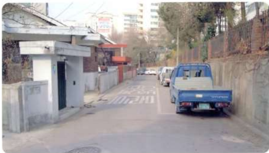
35 신월동 592-17 ~ 592-18 (절골14길)