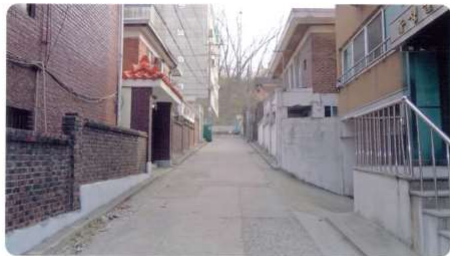
37 신월동 590-2 ~ 590-5 (절골12길)