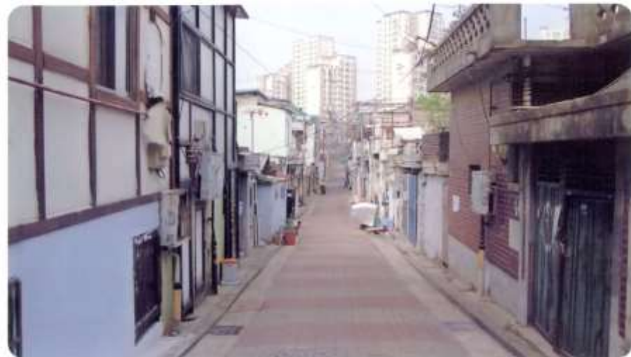
29 신월동 584-1 ~ 584-7 (달맞이길)