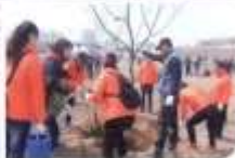
안양천 나무심기 2015