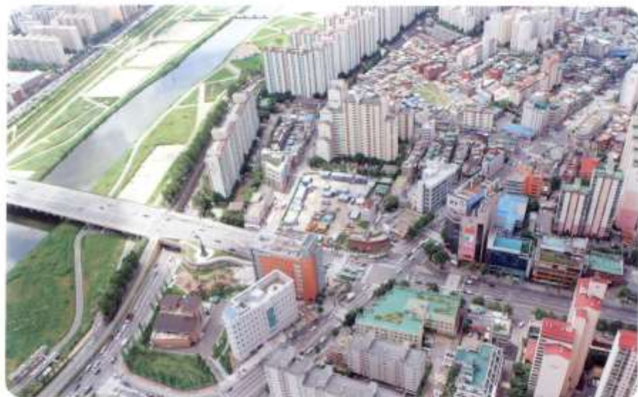
2014. 오목교 사거리