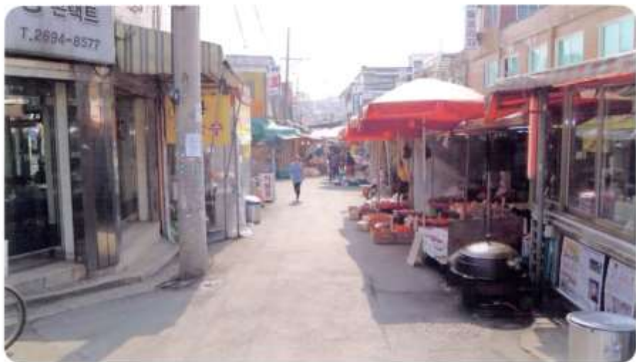
7 신월동 600-17 ~ 600-31 (절골3길)