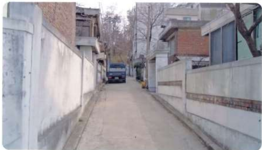
38 신월동 590-10 ~ 590-13 (절골12길)