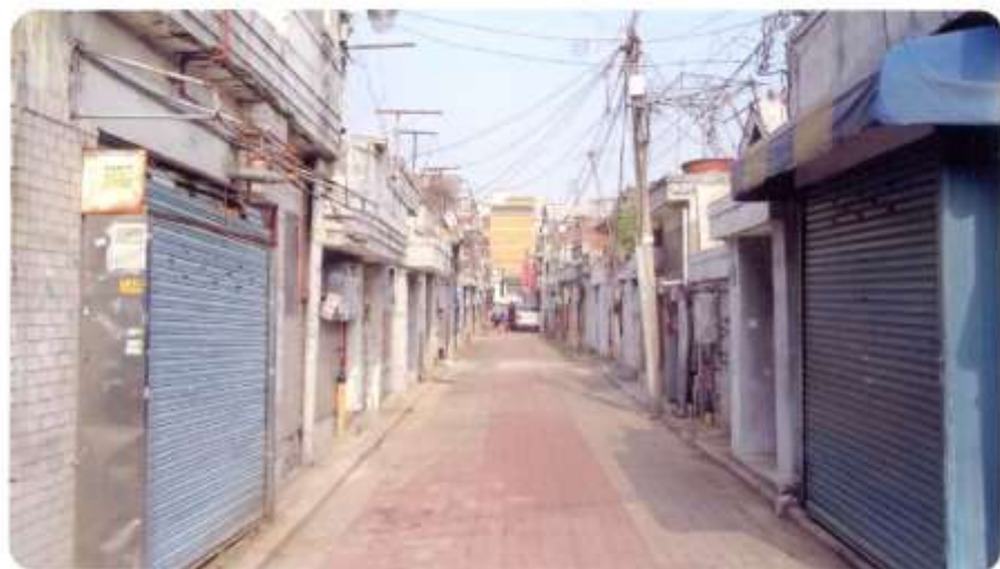
49 신월동 554-1 ~ 554-12 (청황4길)