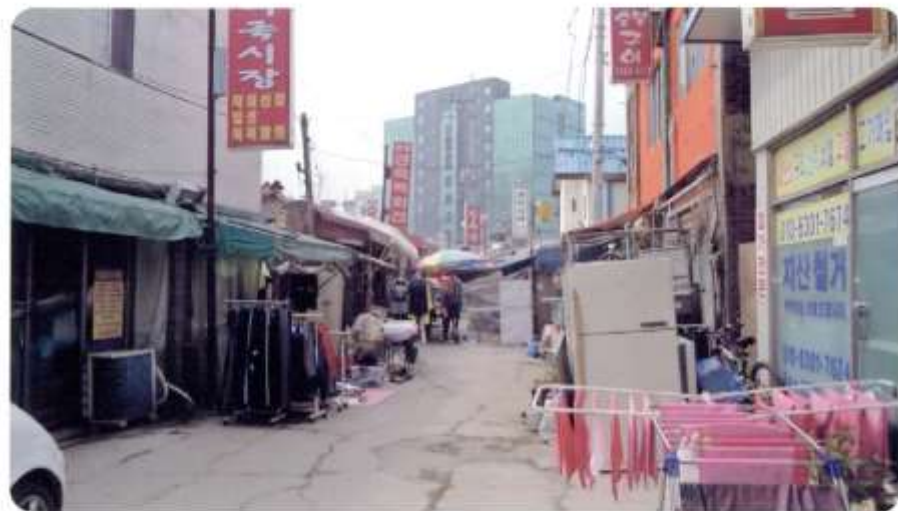
21 신월동 572-8 ~ 573-1 (달맞이1길)