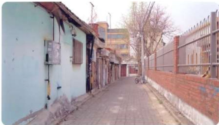
43 신월동 570-29 ~ 570-32 (신남길)