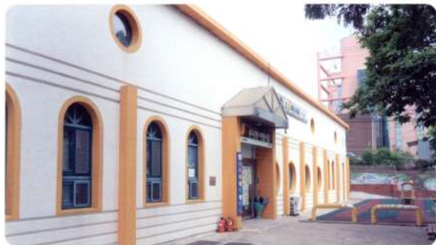
무지개어린이집 [ 신월동 569-1 신남길8 ]