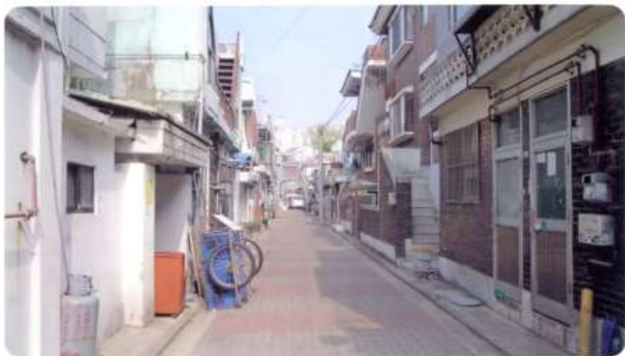
47 신월동 551-1 ~ 551-13 (청황2길)