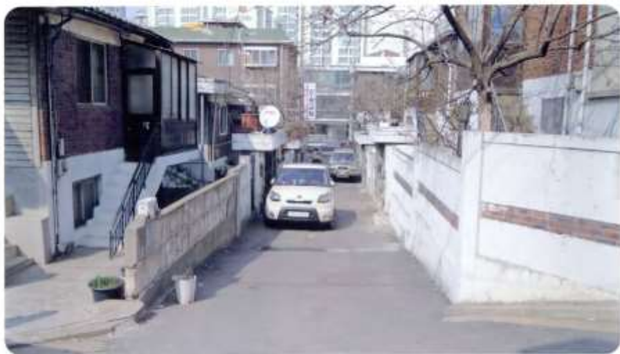
19 신월동 593-15 ~ 593-18 (절골10길)