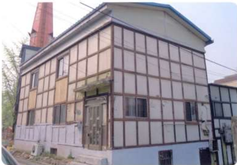
일본식 목조건물 (現 연세지역아동센터)