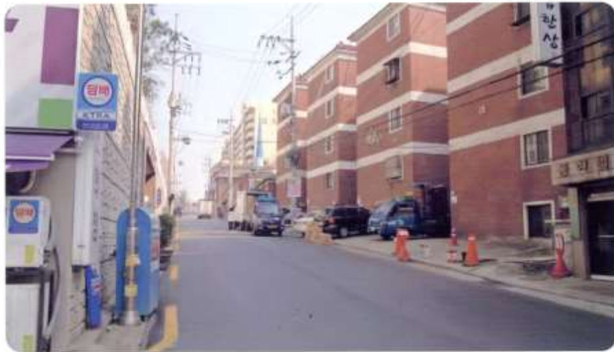
16 신월동 595-1~신안약수아파트 (신월로20길)