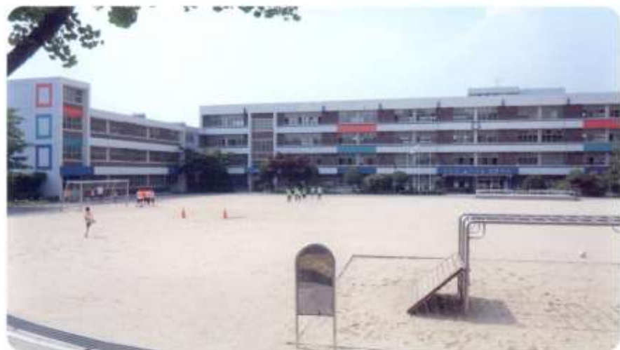
신남초등학교 [ 신월동 587 절골12길 ]