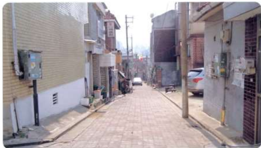
4 신월동 597-1 ~ 597-8 (결골 5길)