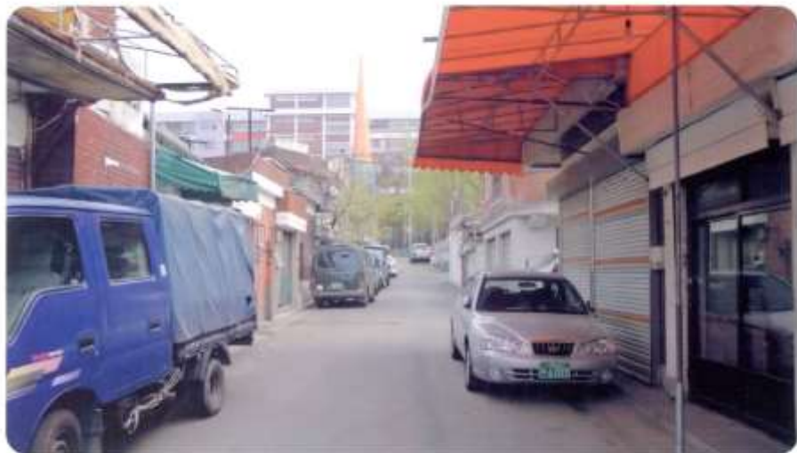
27 신월동 585-7 ~ 586-1 (달맞이길)