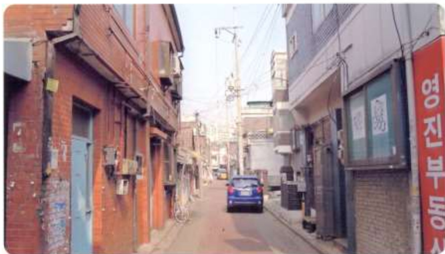
48 신월동 553-1 ~ 553-12 (청황3길)