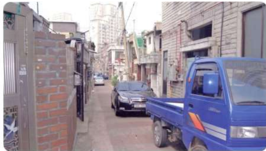
30 신월동 583-1 ~ 583-6 (달맞이길)