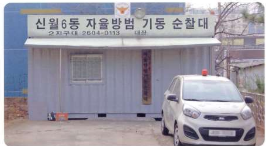
자율방범대 사무실 [ 신월동 568-19 신남3길58 ]