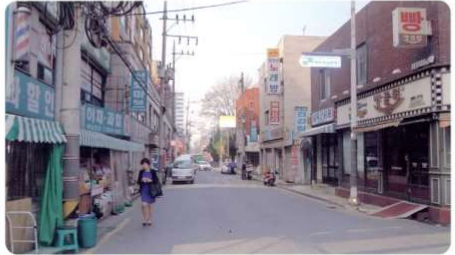
58 신월동 557-1 ~ 557-11 (신월로10길)