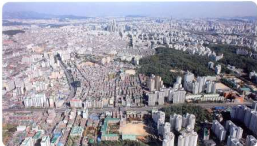
항공사진-2 (앞쪽에 보이는 운동장이 강신중학교 교정)