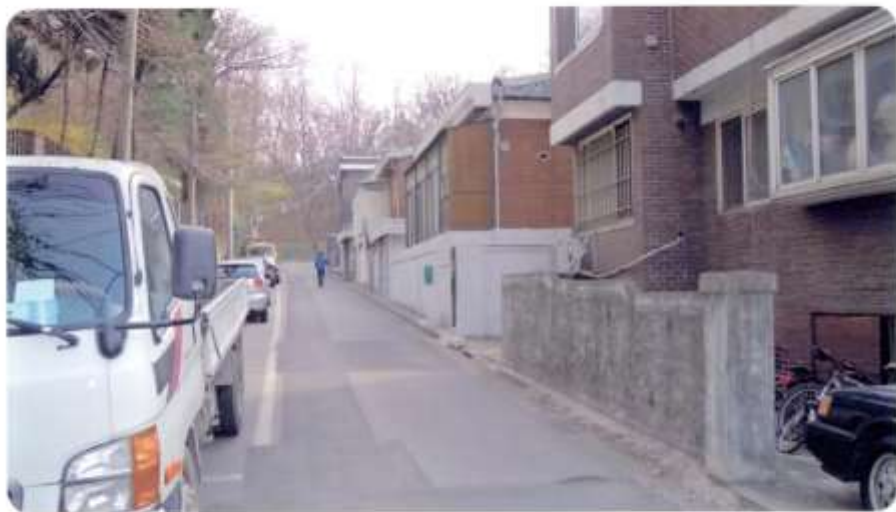
39 신월동 590-18 ~ 590-21 (절골14길)