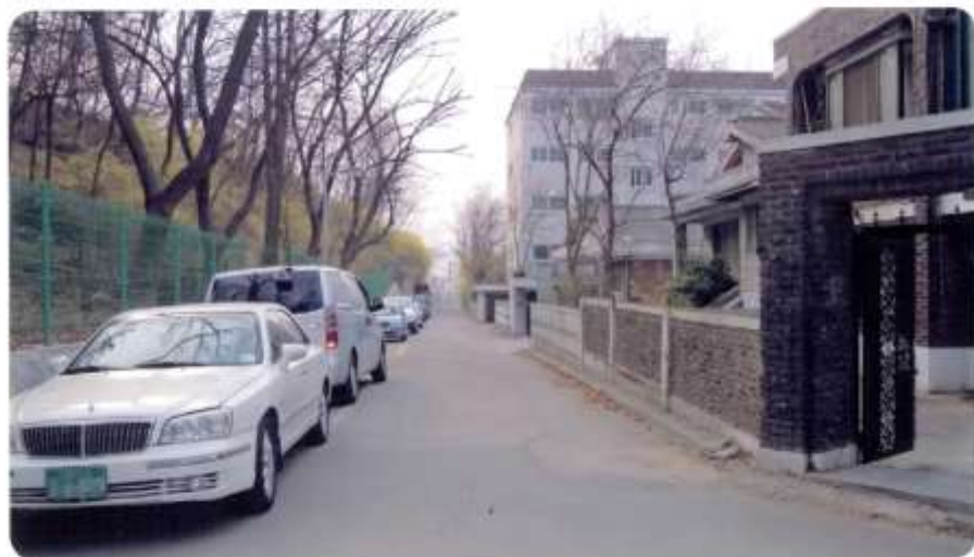
40 신월동 590-5 ~ 590-21 (절골14길)