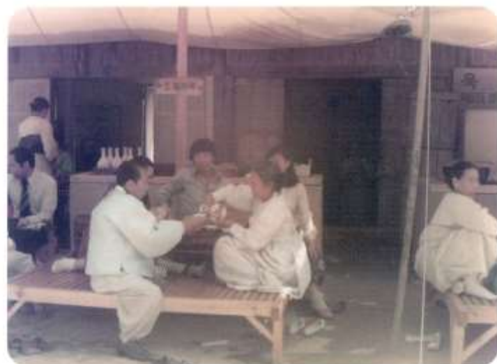
1979년 신곡시장 (막걸리 가게)