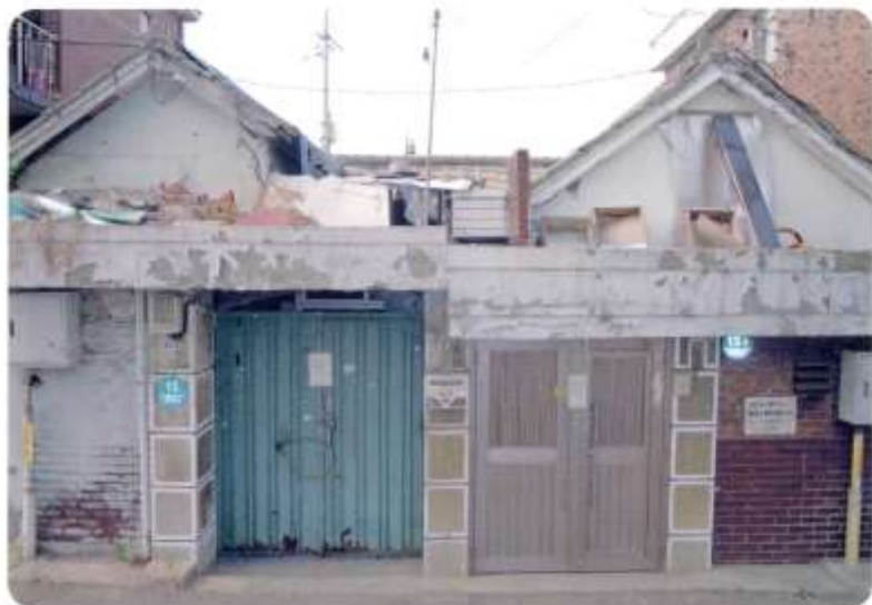
하나의 지붕을 공유하는 두채의 집 (상부)