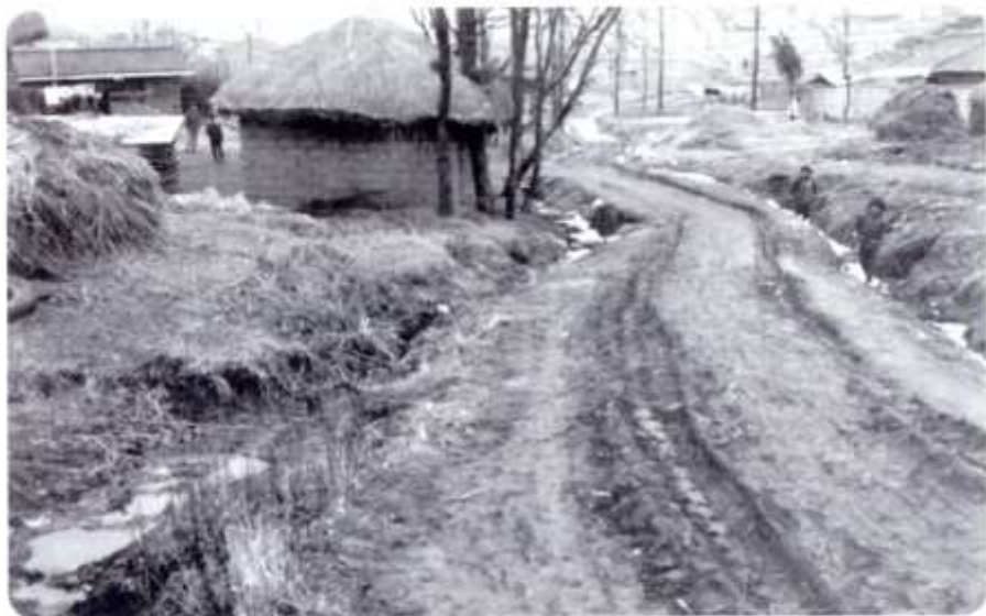
1972. 정랑고개에서 구청방향 내려오는 길