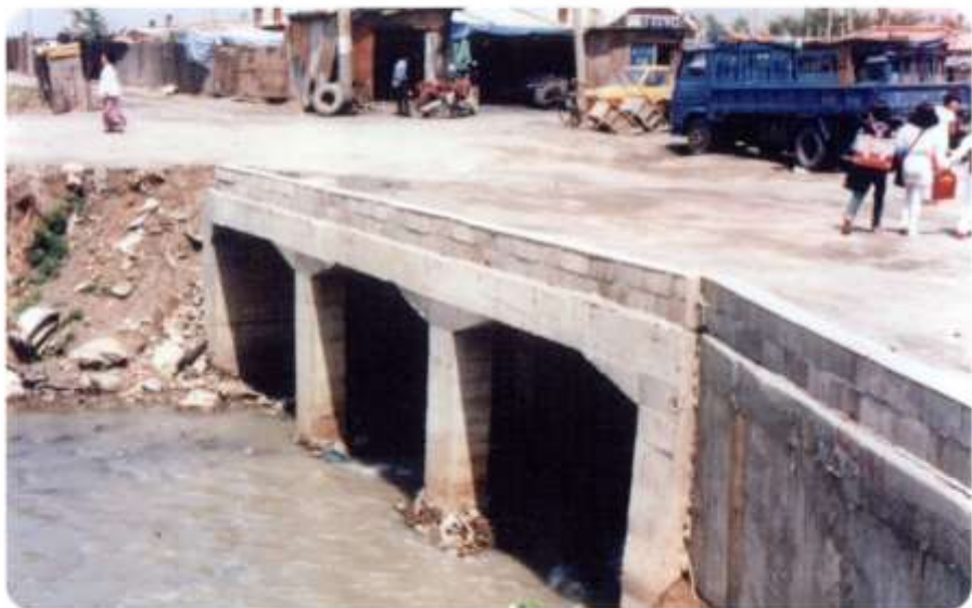
1984. 오목교 독방 (현대백화점 인근)