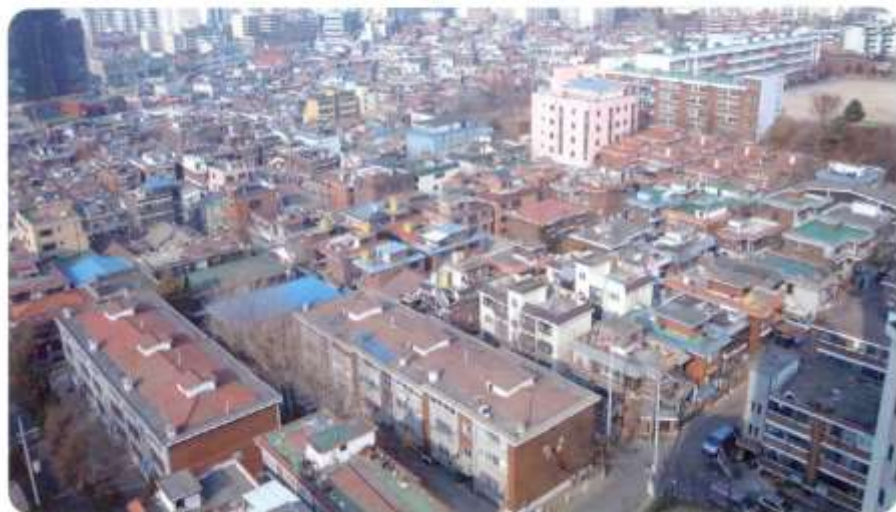
신월동 591번지 신안약수아파트 3동 옥상에서