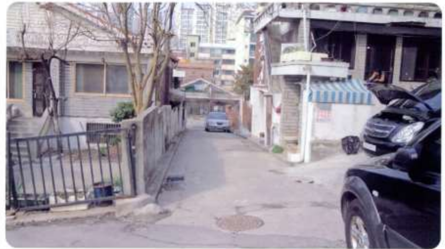
33 신월동 592-4 ~ 593-6 (절곡11길)