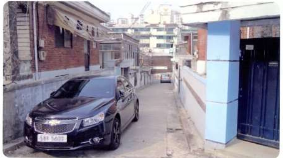
34 신월동 592-10 ~ 592-12 (절굴11길)