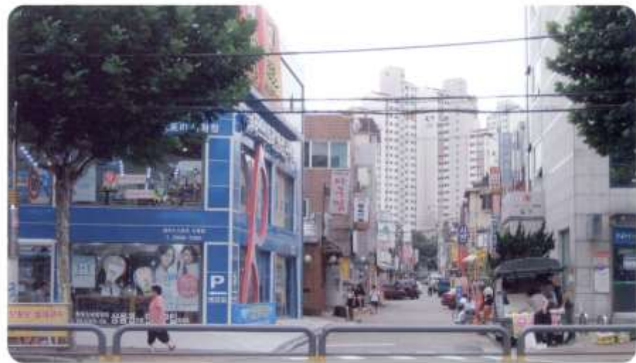
신월동 천황길 Glass Story