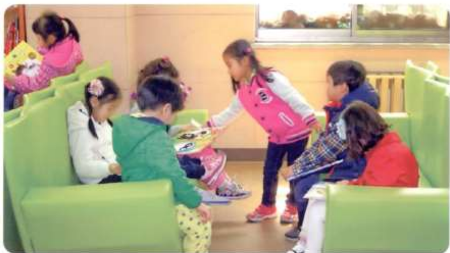
도서방에서... 무지개 어린이집 아이들