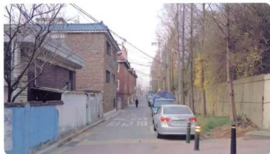
42 신월동 568-17 ~ 568-19 (신남3길)