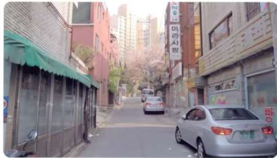
53 신월동 565-1 ~ 565-20 (청황길)