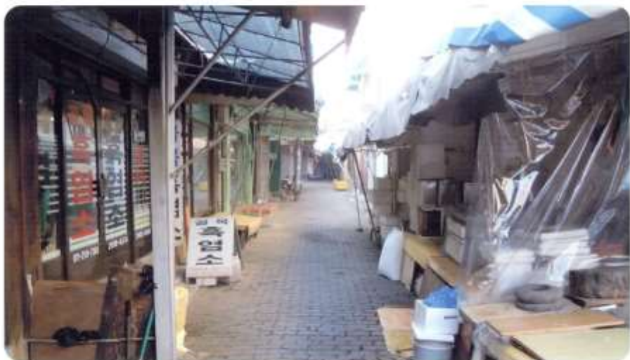
8 신월동 574-1~574-15 (남부순환로79길)