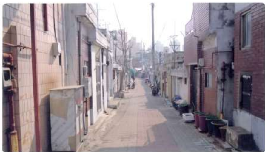
9 신월동 576-2 ~ 576-11 (새곡2길)