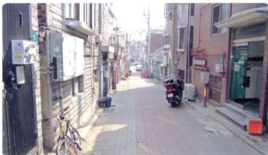
10 신월동 577-2 ~ 577-11 (새곡3길)