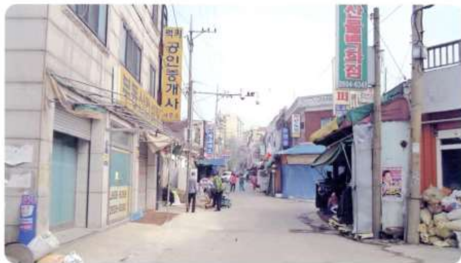
22 신월동 572-9 ~ 583-11 (달맞이1길)