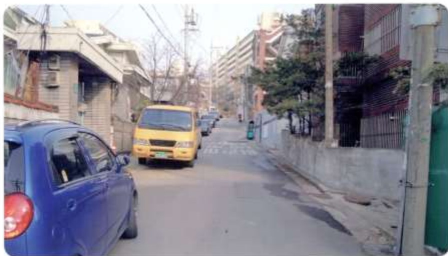
20 신월동 593-9 ~ 593-25 (절골11길)