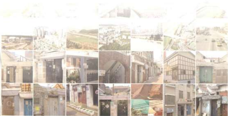
신월6동 주민자치 위원회