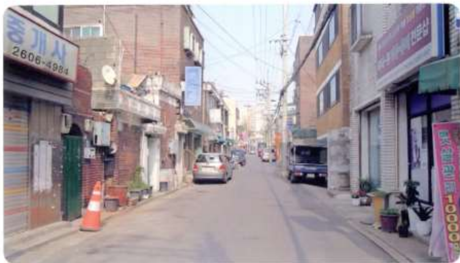
51 신월동 555-13 ~ 555-24 (신남길)