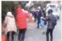
거리 청소 행사 2015.02.17