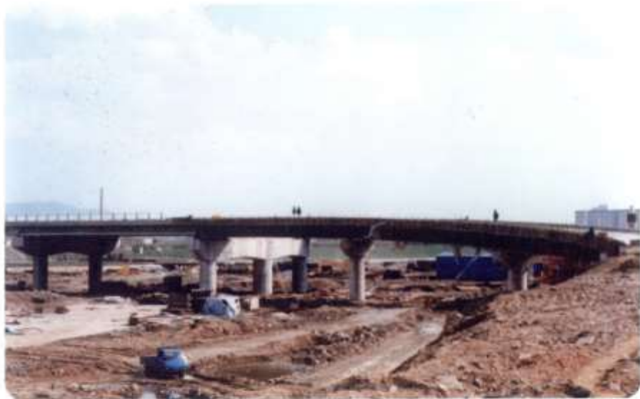
1986.12 목동교 준공