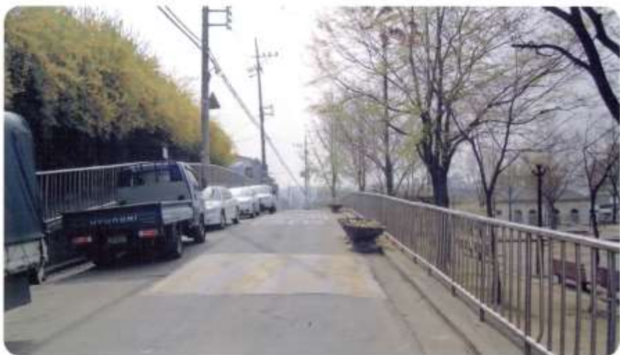
44 신월동 569 ~ 570-28 (신남길)