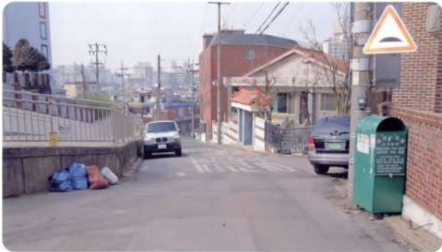
32 신월동 592-1 ~ 592-6 (절굴1길)