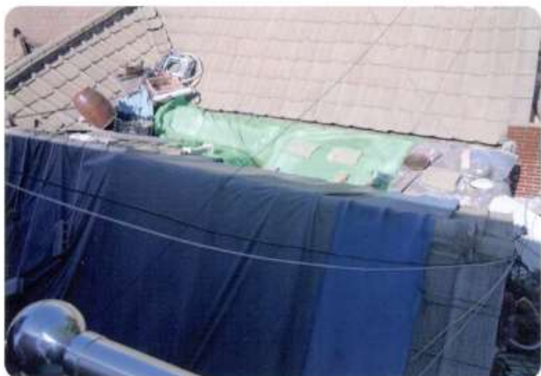
하나의 지붕을 공유하는 두채의 집 (상부)