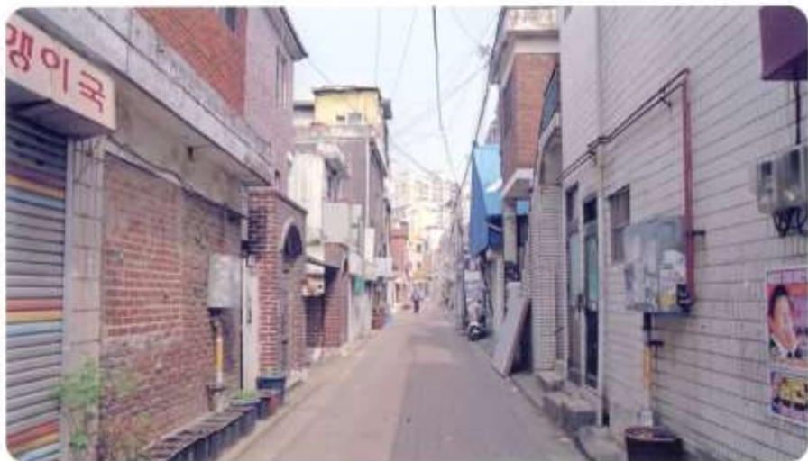
24 신월동 571-1 ~ 571-12 (달맞이2길)