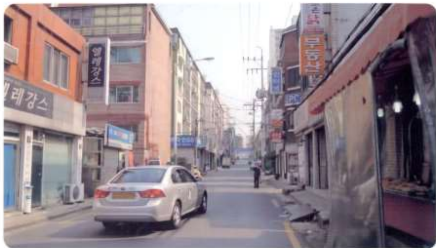
59 신월동 561-5 ~ 562-1 (신월로10길)