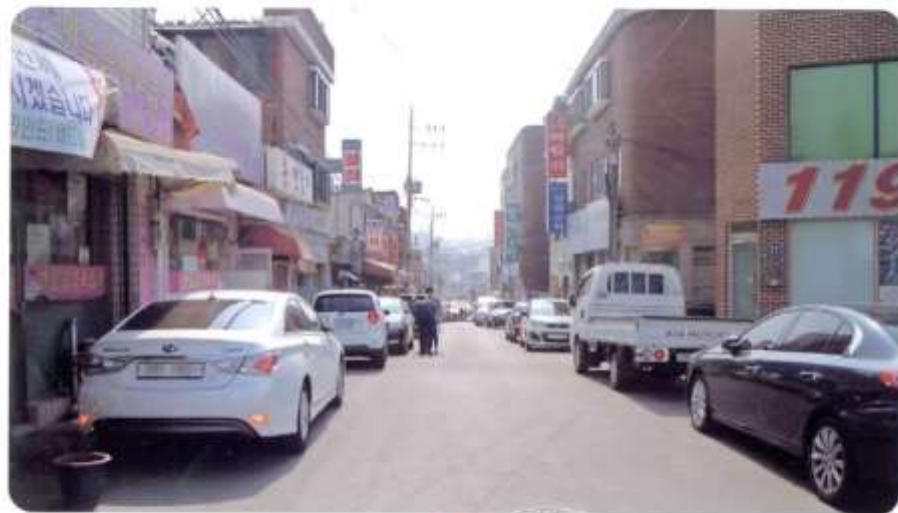
① 신월동 598-1 ~ 598-10 (새곡1길)