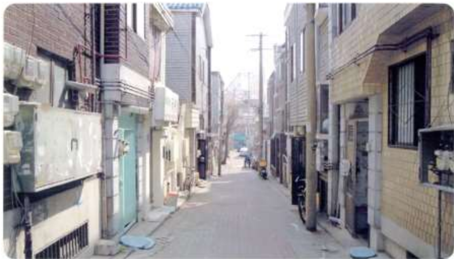
11 신월동 577-2 ~ 577-11 (새곡3길)