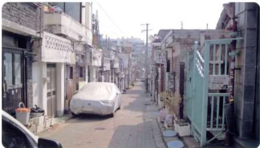
12 신월동 600-17 ~ 600-31 (새곡5길)