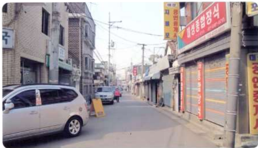
52 신월동 556-9 ~ 556-37 (청황길)