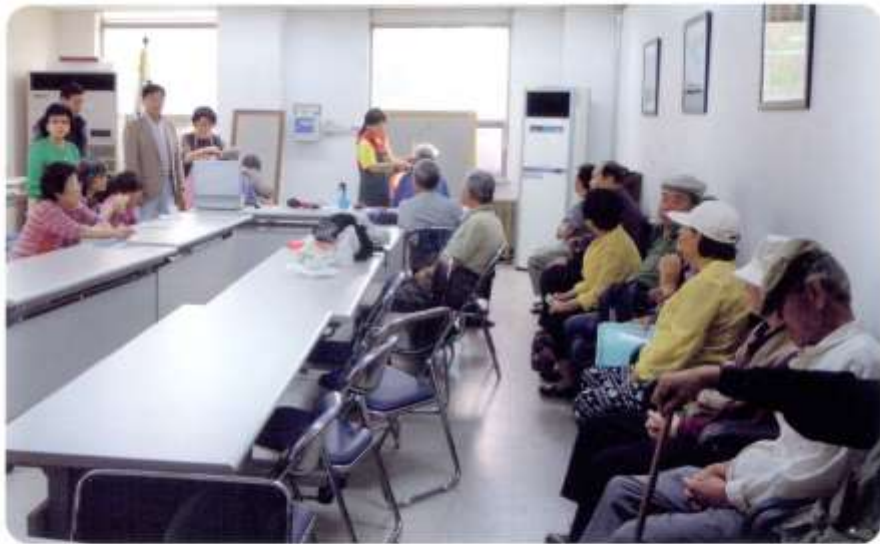
어르신 무료 아미용 봉사