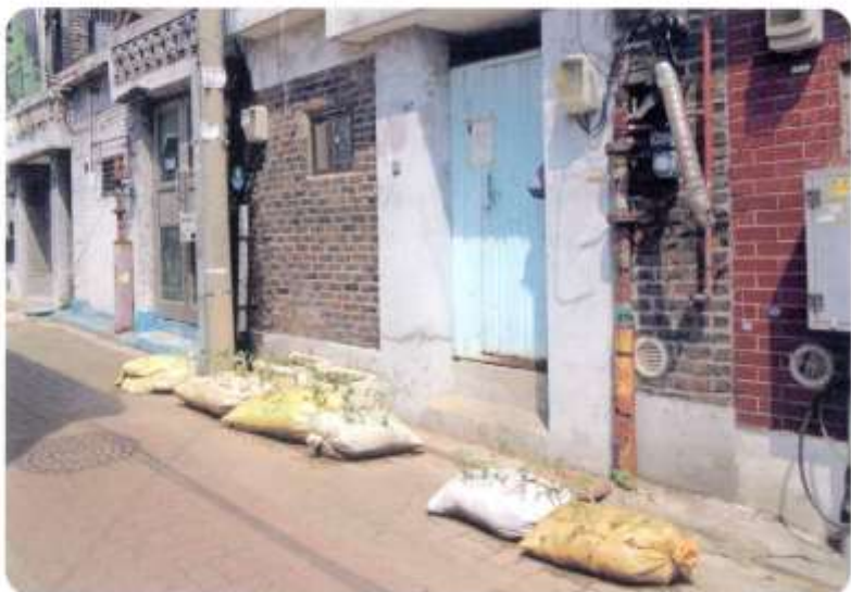
PP포대를 이용해 고구마를 재배하는 모습