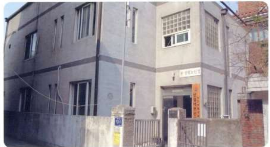
신월어르신사랑방 [ 신월동 557-8 신월로10길13-1 ]