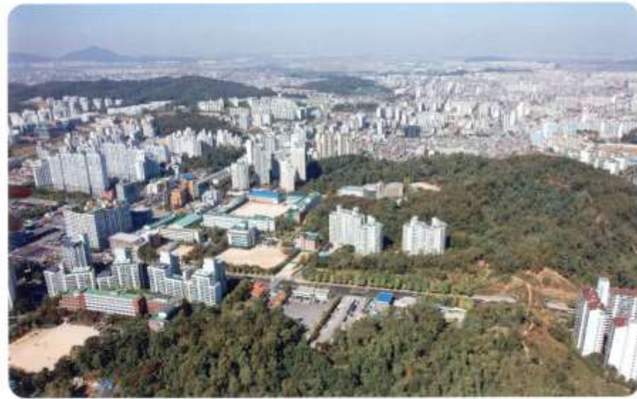
2014. 정랑고개 (금옥여고)