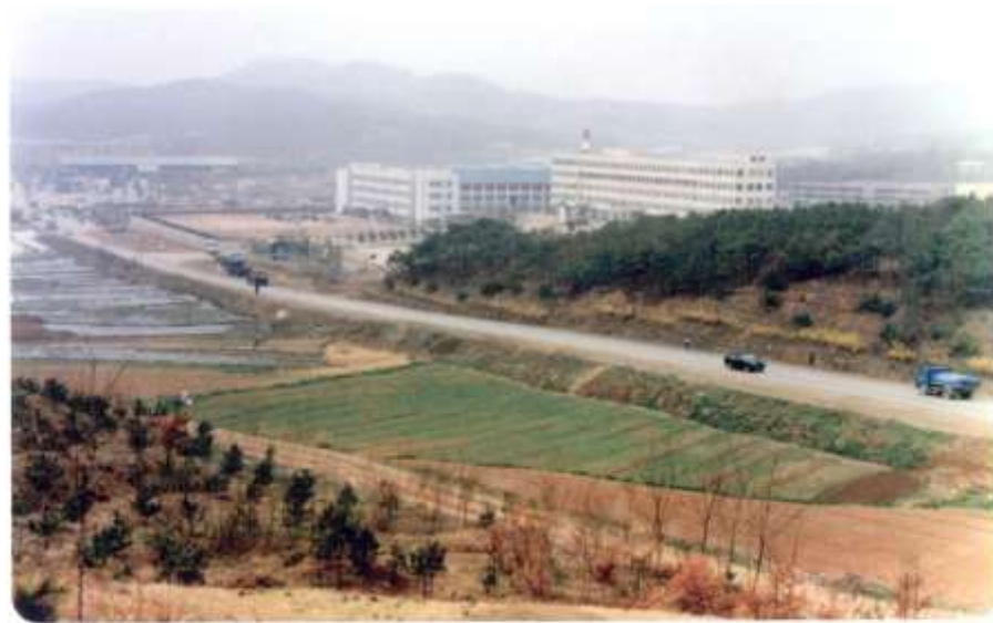
1985. 정면에 보이는 금옥중-여고와 최초 국민차 포니