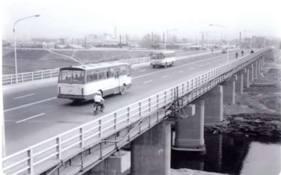
1977. 오목교 확장준공