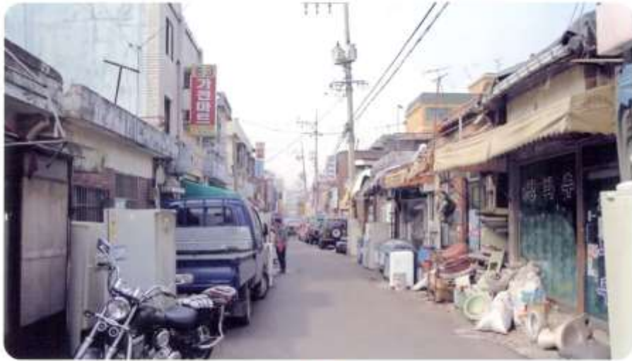
31 신월동 570-28 ~ 573-1 (달맞이길)