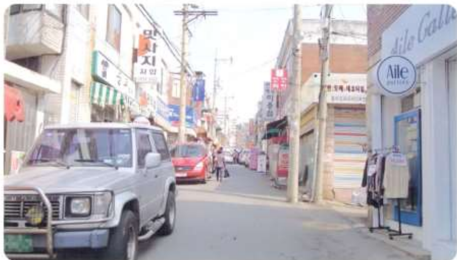
6 신월동 582-2 ~ 600-16 (새곡1길)