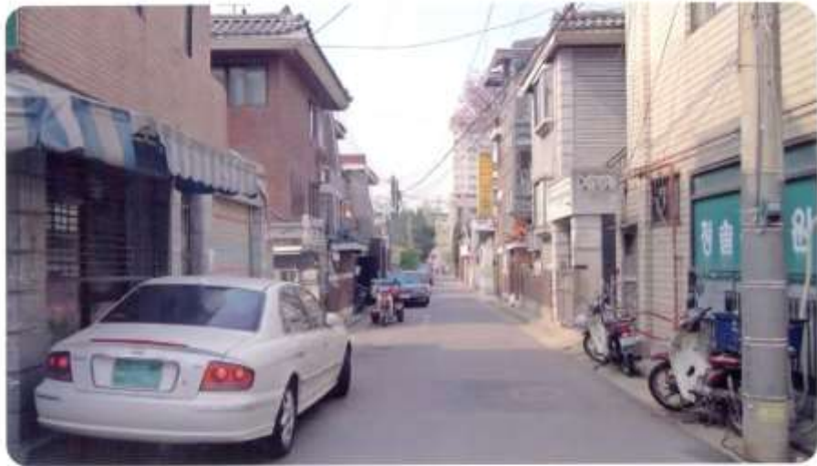
55 신월동 556-1 ~ 556-32 (학동2길)