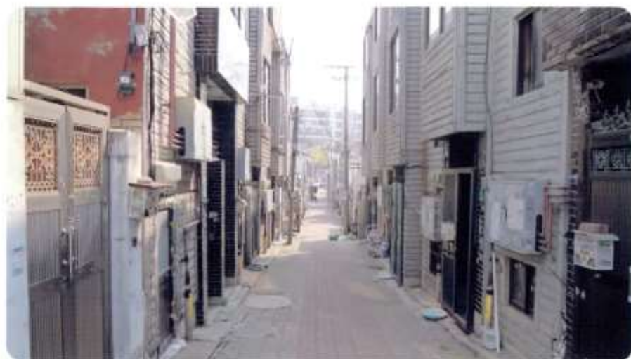
13 신월동 580-2 ~ 580-11 (새곡6길)