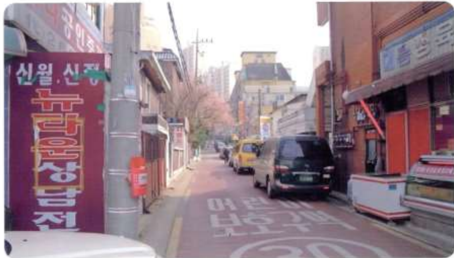
56 신월동 563-1 ~ 563-17 (신남1길)